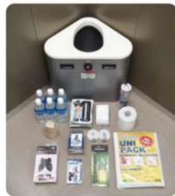
※収納品はスタンダードタイプ プレミアム仕様

もしも災害や停電、故障によってエレベーター内に閉じ込められてしまった場合、大切なお客様を守ります。本体に収納されている非常用品を使って、復旧や救助まで安全に待機することができます。据付工事も必要ありません。